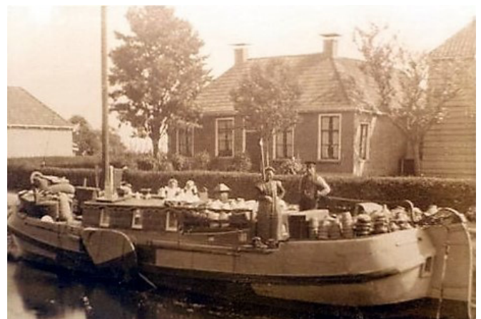
Afb. 1. Potschipper Van der Veer uit Terwispeel. 2

Cornelis Samson overleed twaalf jaar later op 8 augustus 1792. Pas in september 1794 werd op verzoek van de meerderjarige erfgenamen en de voogden over de minderjarige erfgenamen in zijn huis op de noordzijde van de Turfmarkt een boedelinventaris opgemaakt. 12 Naast persoonlijke voorwerpen en 420 gulden aan