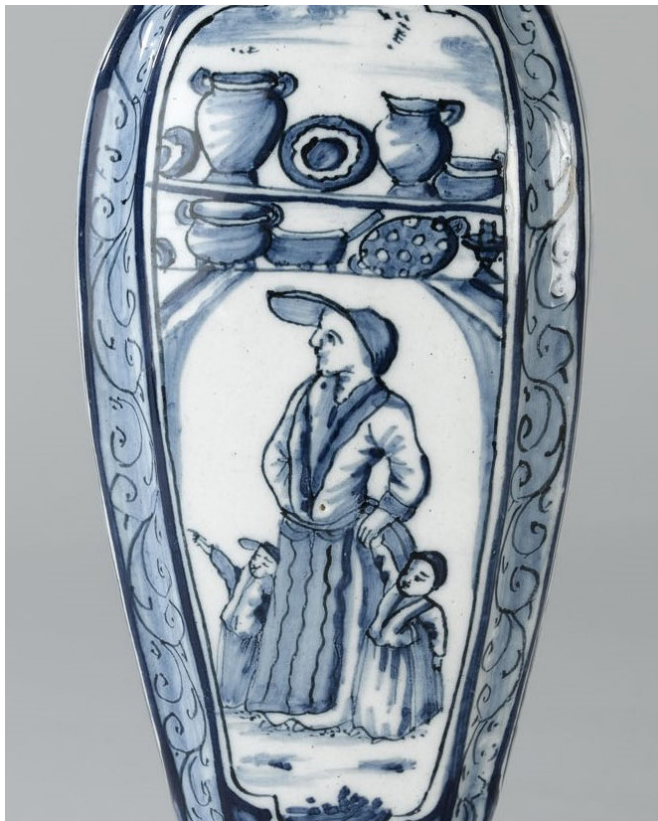
Afb. 3. Vaas van een potschipper. Vrouw met kinderen en kast met aardewerk. Collectie Fries Scheepvaart Museum.

Goudse lijnbanen produceerden touw. De leveranciers van deze goederen hadden 929 gulden en 17 stuivers uitstaan bij Samson.